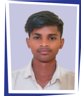
SUMAN KISAN BBL663AS