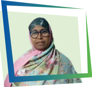
ULEMA BIBI SD