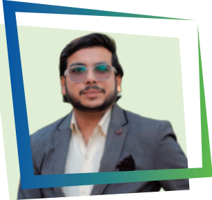
SHUBHAM SHALYA ED